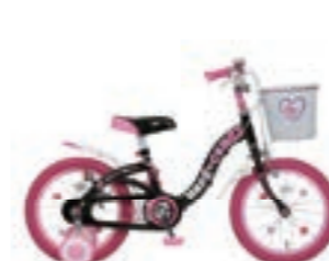
ハードキャンディ HARDCANDY

オリジナルデザイン車の企画を多数手がけています。 ユーザーと共に成長のロングランシリーズ。