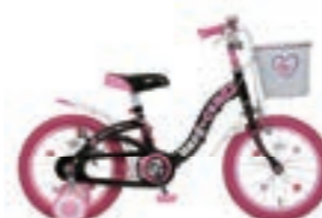
ハードキャンディ HARDCANDY

オリジナルデザイン車の企画を多数手がけています。 ユーザーと共に成長のロングランシリーズ。